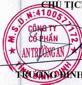
TRƯỜNG ĐÌNH XUÂN